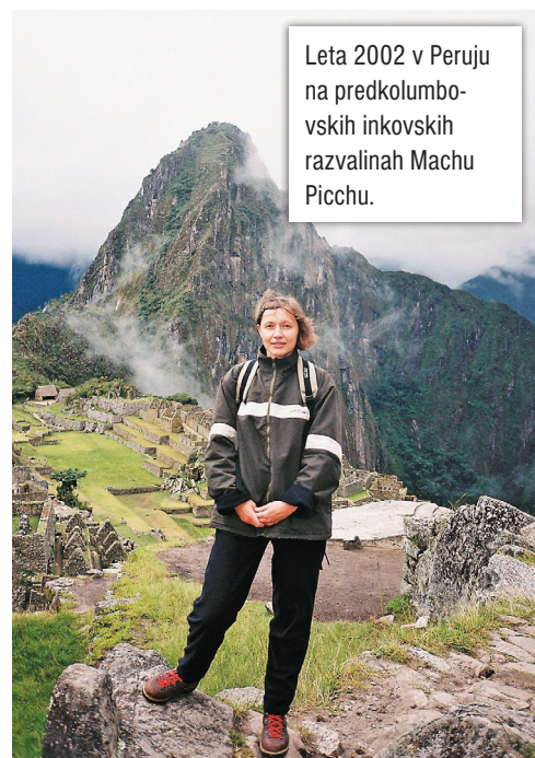
Leta 2002 v Peruju na predkolumbovskih inkovskih razvalinah Machu Picchu.