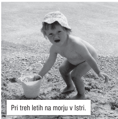
Pri treh letih na morju v Istri.