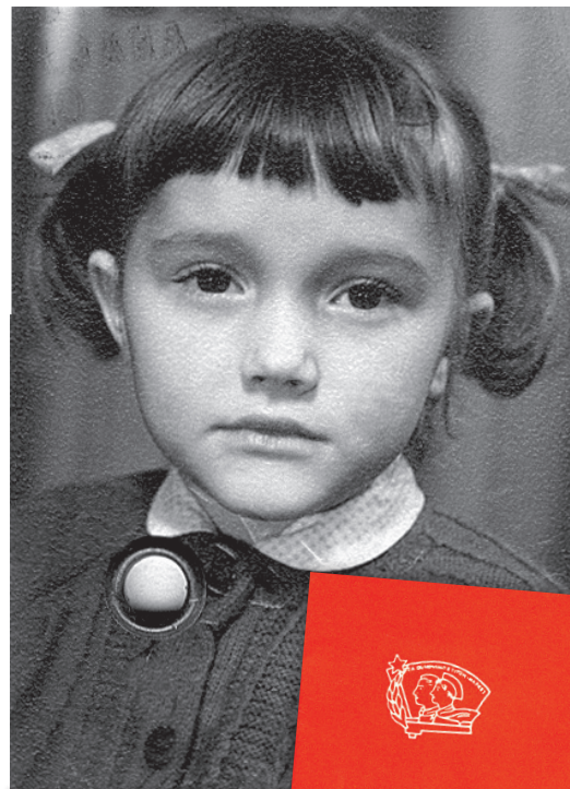
Ko je bila sprejeta v Zvezo pionirjev.