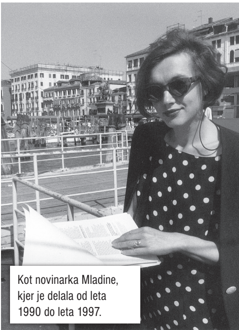
Kot novinarka Mladine, kjer je delala od leta 1990 do leta 1997.