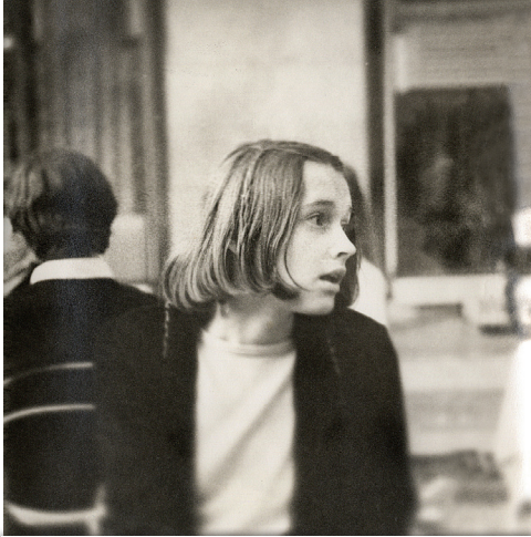
Obiskovala je »Šubičko«, Gimnazijo Jožeta Plečnika. Ni ji bilo mar za materialne dobrine, kar je kot pubertetnica uporniško izražala s svojim boemskim videzom.