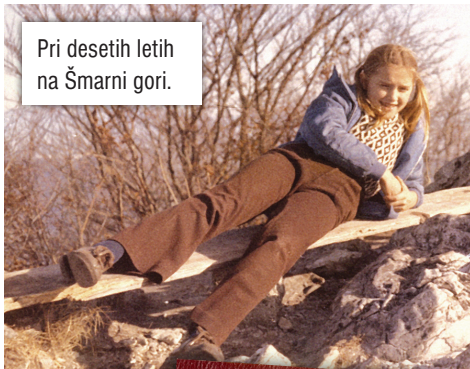
Pri desetih letih na Šmarni gori.