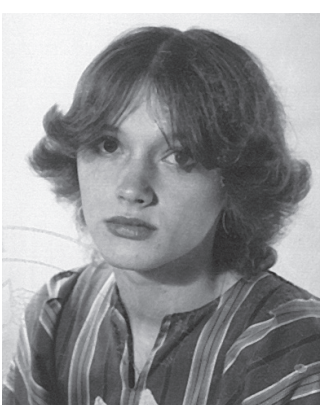
Slika iz indeksa. Študirala je primerjalno književnost na Filozofski fakulteti v Ljubljani ter kot dodatni predmet še starogrški jezik s književnostjo.