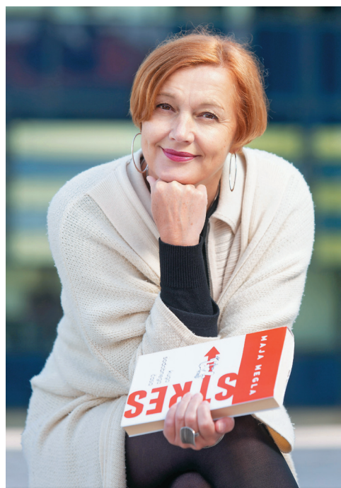
Piše tri nove knjige. Prva z naslovom Reset Restart raziskuje človekove temeljne pravice, odnos do sebe (umetnost bivanja) in odnos do drugih (umetnost sobivanja); v drugi se je podala v svet vrednot, stereotipov, predsodkov in mitov; o tretji pa nam je izdala le naslov: Smem biti to, kar sem . Vse naj bi izšle naslednje leto.

paj smo se družili fantje in dekleta, brez razlik. Igrali smo se igre, ki so primerne za vse, najrajši skrivalnice ali pa igre z žogo. Otroci vseh generacij smo zbirali sredstva za nakup mize za namizni tenis. Bila je last vseh in vsi smo se ob njej igrali in družili.« Spominja se, da je bil to čas, ko so bile barvne televizije še redke. »Ko smo jo dobili, me je začarala. V moje življenje je vstopila živa Pika Nogavička, otroška nadaljevalka Beli kamen, Bratovščina Sinjega galeba, Erazem in potepuh, Naočnik in očalnik ter superjunaki partizanske serije. Dostopnih je bilo le nekaj televizijskih programov, zato smo filme in nadaljevanke čakali kot svetinjne.«