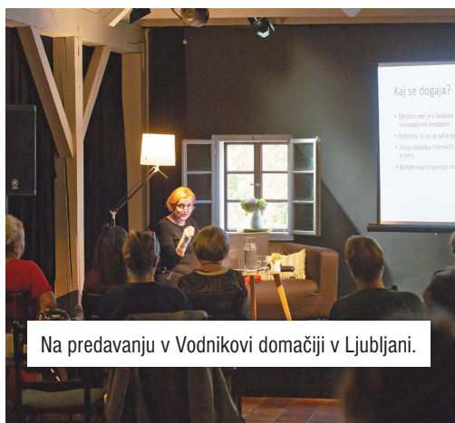
Na predavanju v Vodnikovi domačiji v Ljubljani.