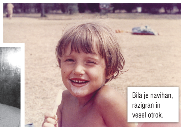
Bila je navihan, razigran in vesel otrok.