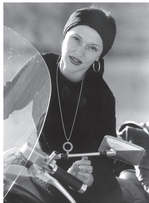
Na Delu so ji poslali odpoved kar na dom, ko je bila v bolniškem staležu, in sicer tik pred božičem leta 2015.