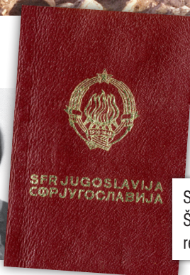
Slika iz prvega potnega lista. Še iz Socialistične federativne republike Jugoslavije (SFRJ).