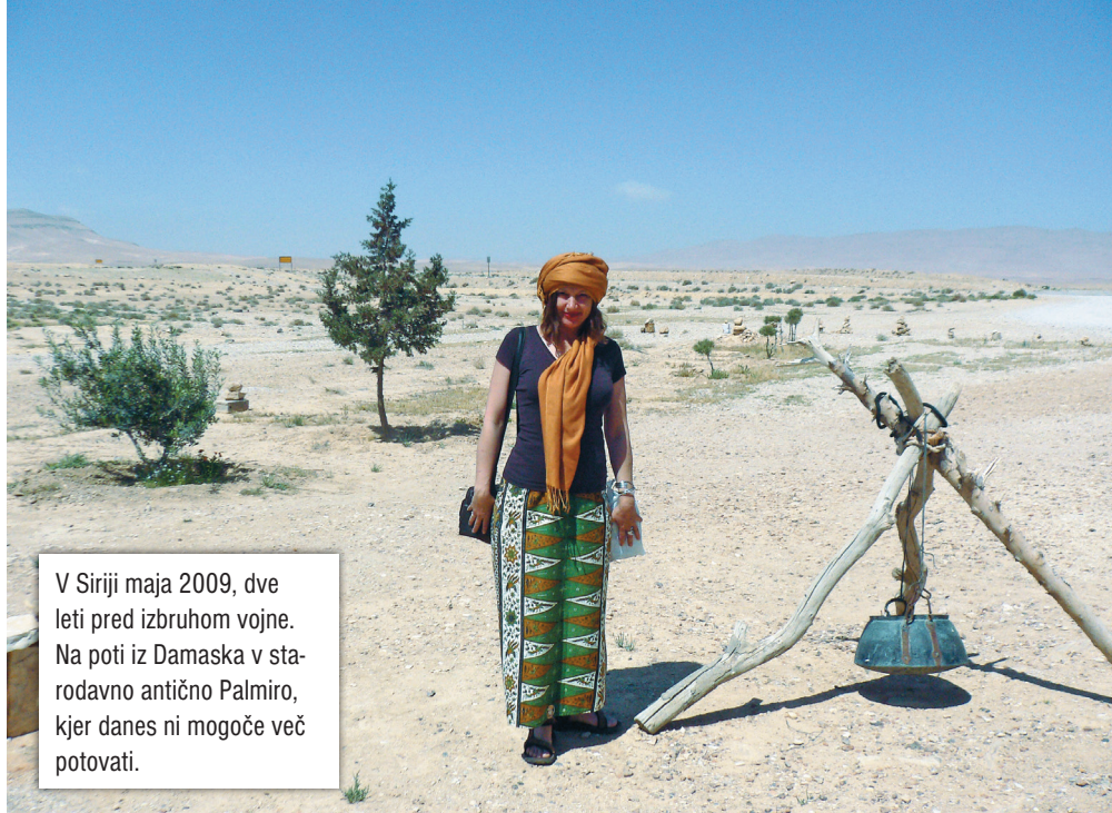
V Siriji maja 2009, dve leti pred izbruhom vojne. Na poti iz Damaska v starodavno antično Palmiro, kjer danes ni mogoče več potovati.