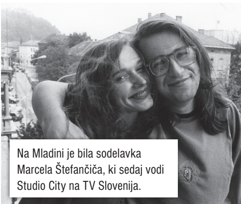
Na Mladini je bila sodelavka Marcela Štefančiča, ki sedaj vodi Studio City na TV Slovenija.