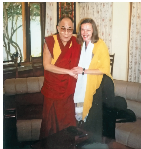
S tibetanskim duhovnim voditeljem Dalajlamo leta 2001 v njegovi rezidenci v indijski Dharamsali po pogovoru za Sobotno prilogo.