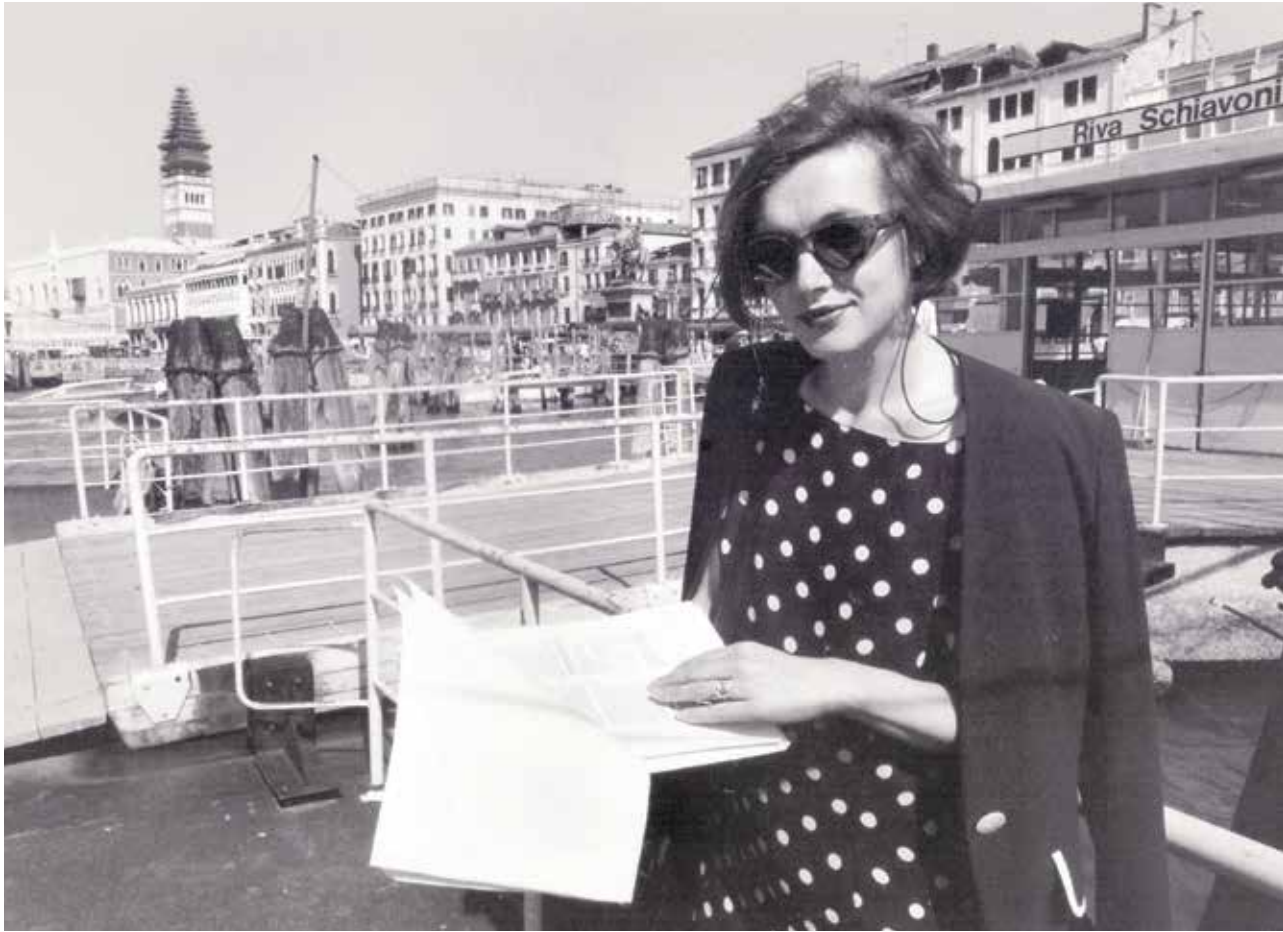
Na Beneškem bienalu junija 1997